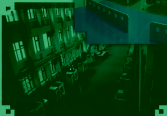
DMG 数控技术 训练场所