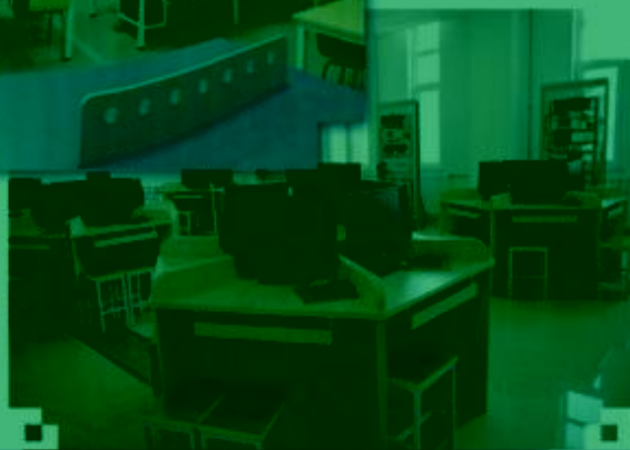
一体化课程教学设计 综合实训室